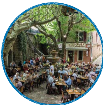
La Gloire de mon Père