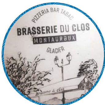
Brasserie du Clos

7 av Jean-Camille Pauc - Place du Clos - Montauroux