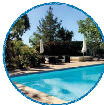
L'Auberge des Pins

1391 chemin du Vieux Moulin - Tourrettes