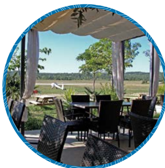
Le Vol à Voile