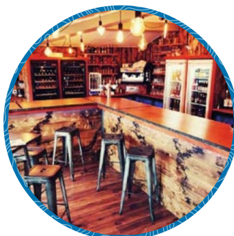
Le Mas des Anges