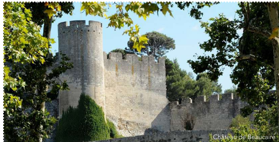
Château de Beaucaire