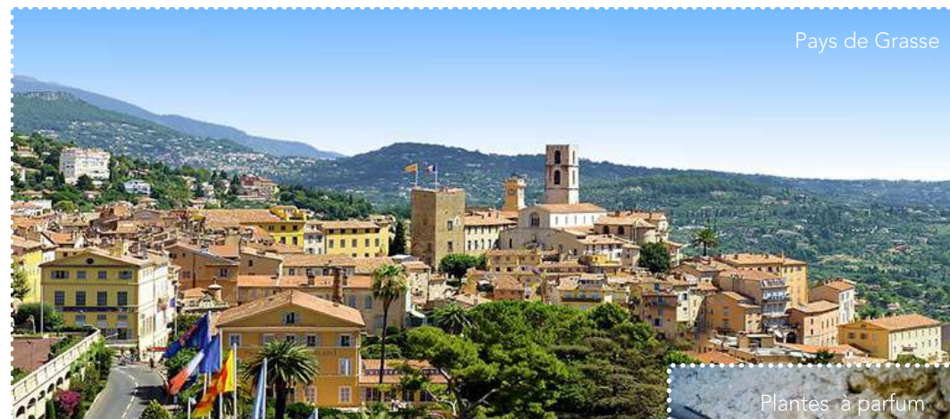
Pays de Grasse