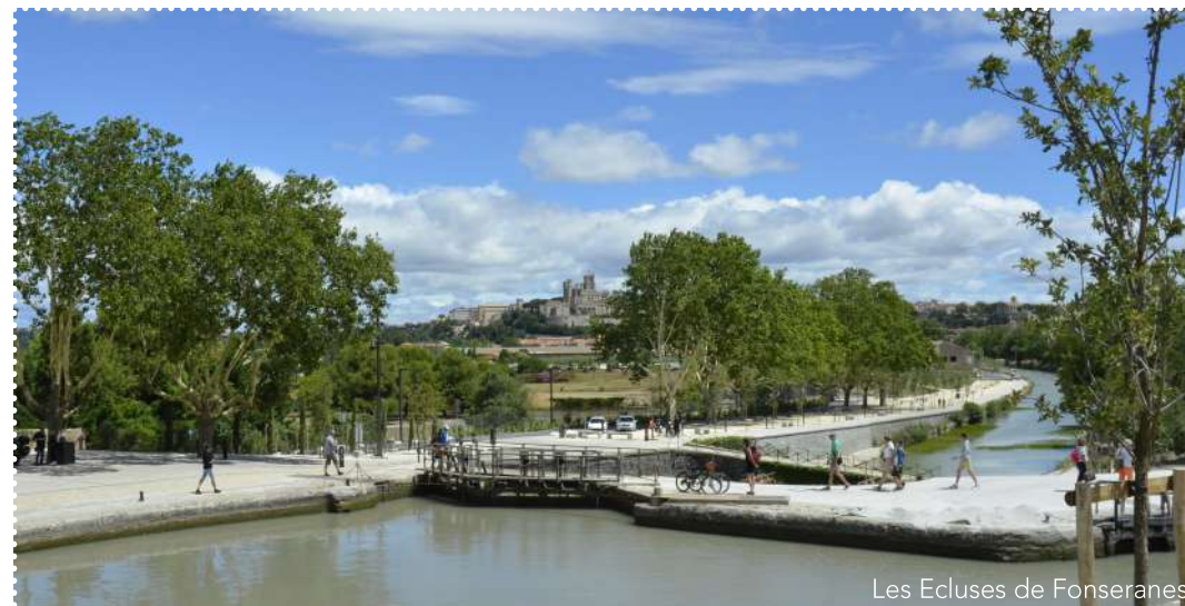
Les Ecluses de Fonseranes