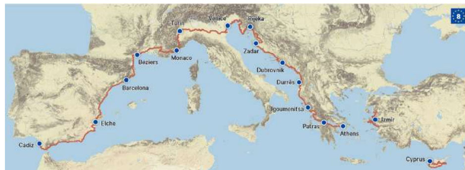
Carte de l'EuroVelo 8

C'est officiel, l'EuroVelo 8 se poursuivra à terme jusqu'en Turquie. L'itinéraire méditerranéen reliera Cadix en Espagne à Izmir en Turquie sur un linéaire de 7500 km à travers 11 pays du bassin méditerranéen.