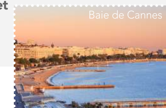
Baie de Cannes