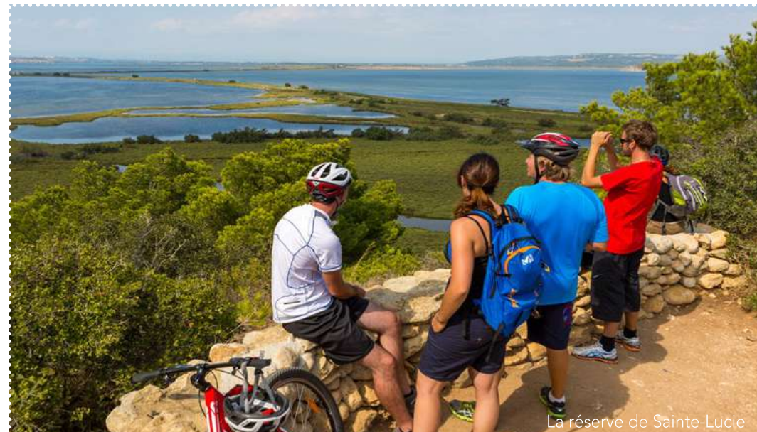
La réserve de Sainte-Lucie