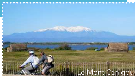
Le Mont Canigou

Retrouvez les établissements Accueil Vélo sur www.lamediterraneeavelo.com