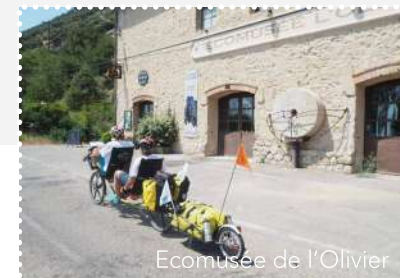
Ecomusée de l'Olivier