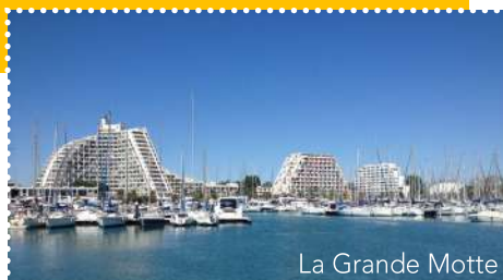
La Grande Motte

Retrouvez les établissements Accueil Vélo sur www.lamediterraneeavelo.com