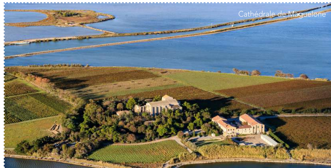
Cathédrale de Maguelone