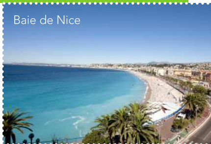
Baie de Nice

Gares de Cannes Golfe Juan, Juan-les-Pins, Antibes, Biot, Villeneuve-Loubet, Cagnes-sur-mer, St-Laurent-du-Var, Nice, Villefranche-sur-Mer, Beaulieu-sur-Mer, Eze, Cap-d'Ail, Monaco, Roquebrune-Cap-Martin, Menton (lignes TER).